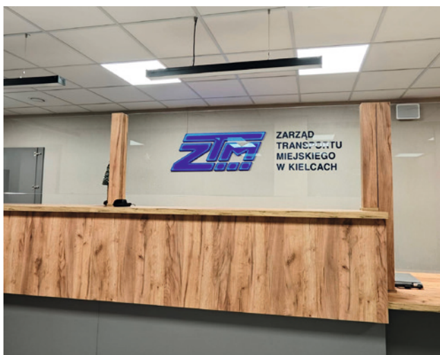
● Punkt Obsługi Pasażera mieści się obecnie na I piętrze Dworca Kolejowego. Czynny jest w poniedziałki w godz. 7:00-16:30 oraz od wtorku do piątku w godz. 7:00-15:00.

Siedziba ZTM spełnia wszystkie wymogi i udogodnienia, tak dla pracowników, jak też zwłaszcza dla pasażerów. Lokalizacja w centrum miasta, z dobrym dojazdem komunikacją zbiorową oraz to, że budynek dworca kolejowego spełnia wszystkie standardy dostępności sprawiają, że sprawy bez przeszkód załatwią tu wszyscy zainteresowani, w tym też m.in. seniorzy i osoby z niepełnosprawnościami.