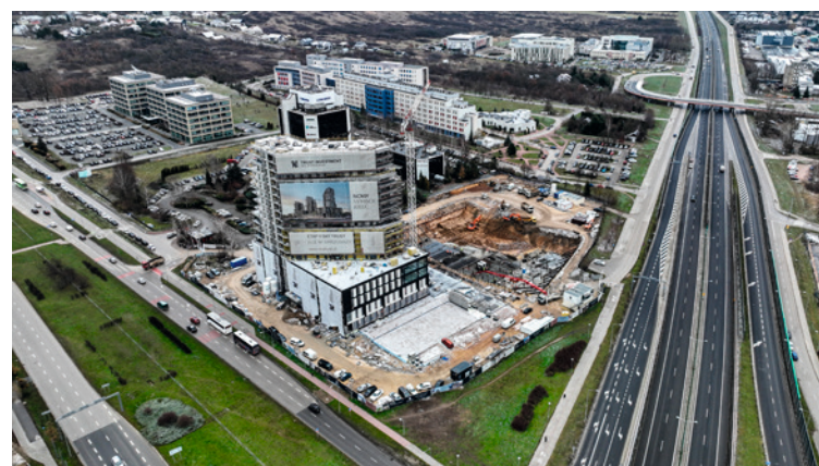
● Ulice Uniwersytecka i Taylora staną się własnością Miasta Kielce.