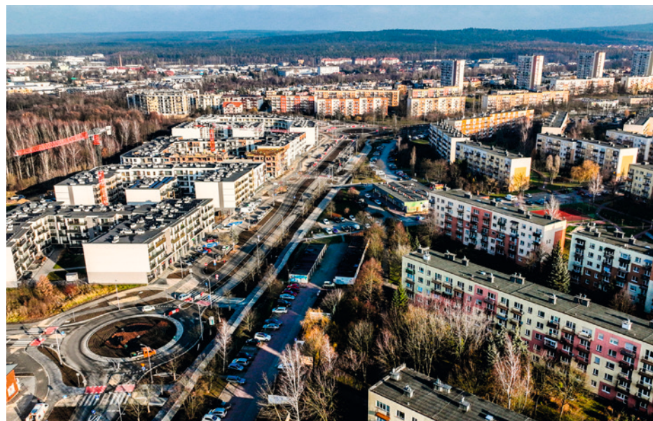
● Na ulicy Klonowej powstały dwa nowe ronda – jedno w sąsiedztwie bloku numer 71 i drugie, turbinowe u zbiegu Klonowej i Orkana.

T ym samym zakończone zostaną dwie największe w ostatnim czasie inwestycje drogowe na północy Kielc. Co ważne, stanie się to dziewięć miesięcy przed czasem. Szybkie tempo prac to efekt zaangażowania realizatora zadania, firmy STRABAG oraz bardzo dobrej współpracy na linii Miasto Kielce - Miejski Zarząd Dróg - wykonawca.