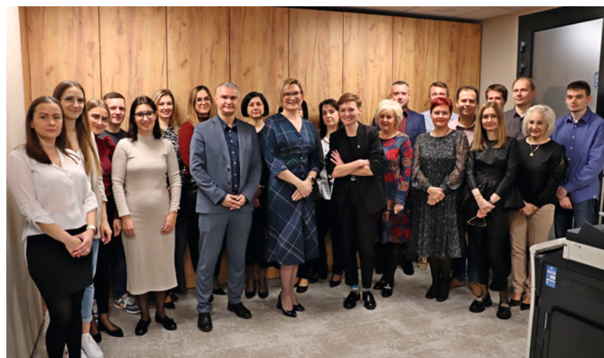
● Na blisko 800 metrach kwadratowych powierzchni znalazły się wszystkie biura ZTM. Nowa siedziba spełnia wszystkie wymogi i udogodnienia dla pracowników i pasażerów.

- Dla nas bardzo ważne jest, żeby urzędnicy, pracownicy naszych wydziałów i miejskich instytucji pracowali w godnych, komfortowych warunkach. To się przekłada na jakość pracy, na ich zadowolenie, a co za tym idzie na jakość obsługi klientów - przekonuje prezydentka Kielc, Agata Wojda.