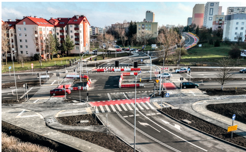
● Po przebudowie skrzyżowania ulic bp. Jaworskiego z Zapolskiej i Piłsudskiego ruchem sterować będzie sygnalizacja świetlna. To zdecydowanie poprawi bezpieczeństwo.

W piątek, 20 grudnia w godzinach wieczornych (ok. 22:00) wprowadzona zostanie stała organizacja ruchu na ul. Klonowej oraz na skrzyżowaniu ul. bp. Jaworskiego, Zapolskiej i Piłsudskiego, a także ul. Piłsudskiego i Orłąt Lwowskich. Od soboty na stare trasy wraca komunikacja miejska