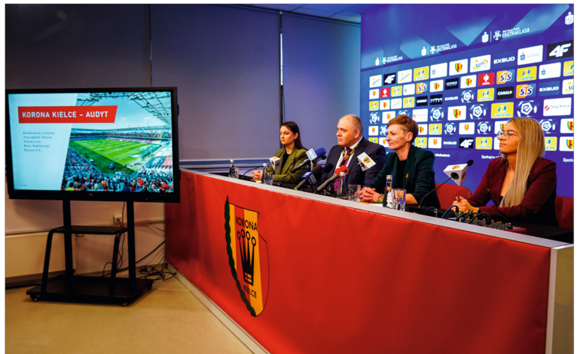
● Firma, która na zlecenie Miasta przeprowadziła audyt, przygotowała szereg wniosków i rekomendacji. Wśród nich są m.in. optymalizacja kosztów i zwiększenie przychodów spółki.

Ponadto, jak informują władze Kielc, prowadzone są rozmowy z podmiotami zainteresowanymi