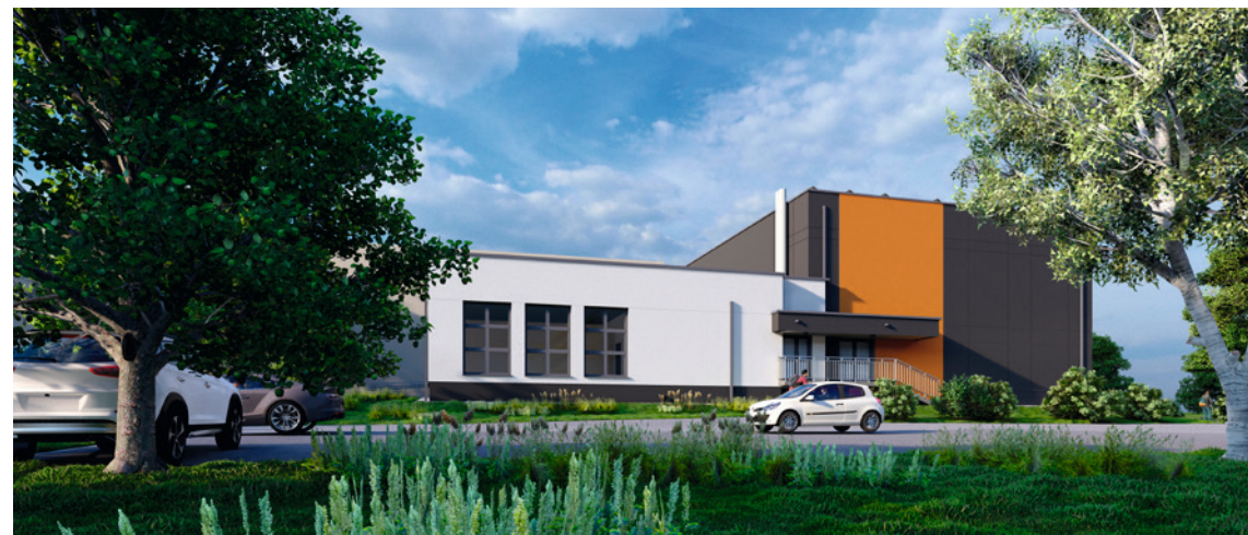
● W nowej hali przy Ściegiennym oprócz sali gimnastycznej powstaną także dwie sale lekcyjne.

Na obie inwestycje MOSiR-u zabezpieczono ponad 1,1 mln zł.