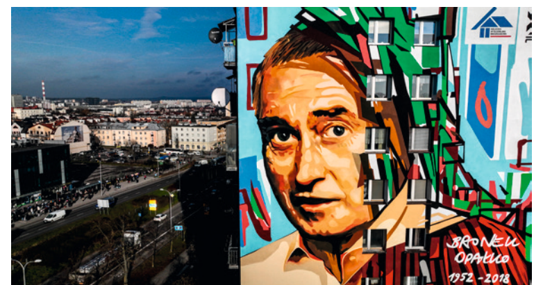
● Mural z wizerunkiem Bronisława Opałki powstał na ścianie bloku przy ul. Chopina 17.

mieszkańcom o wybitnym artyście, który poprzez swoją twórczość rozświetlił region świętokrzyski w całej Polsce. Pracę można podziwiać na jednej ze ścian bloku przy ulicy Chopina 17 na kieleckim osiedlu KSM.