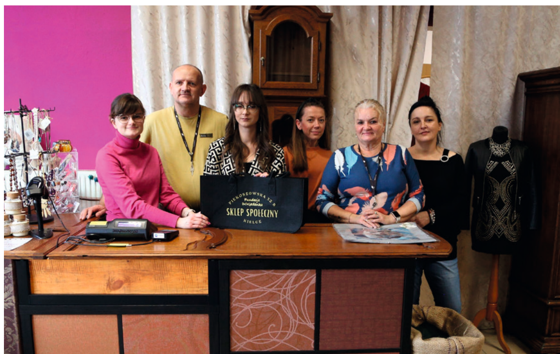
● W Sklepie Społecznym przy ul. Piekoszowskiej 32 B można znaleźć rękodzieło, niepowtarzalne ubrania, bibeloty, zabawki i przede wszystkim zespół, gotowy do pomocy.

Każda rzecz, która trafia do sklepu, przechodzi metamorfozę. Ubrania są ozonowane, prasowane i gotowe na swoją drugą szansę. Te, które nie nadają się do sprzedaży, są przekazywane do