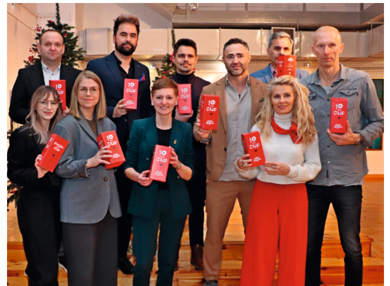
● Inauguracja akcji odbyła się w Kieleckim Centrum Kultury z udziałem jej inicjatorów i partnerów oraz redaktorów naczelnych kieleckich mediów.

– Pomaganie jest czymś bardzo naturalnym, niejednokrotnie, jako kielczanie i kielczanki udowodniłiśmy, że jesteśmy w tym bardzo dobrzy. Jednak, aby pomagać skutecznie, potrzebujemy organizacyjnego wsparcia. Stąd pomysł na „Sztukę Pomagania” – mówiła