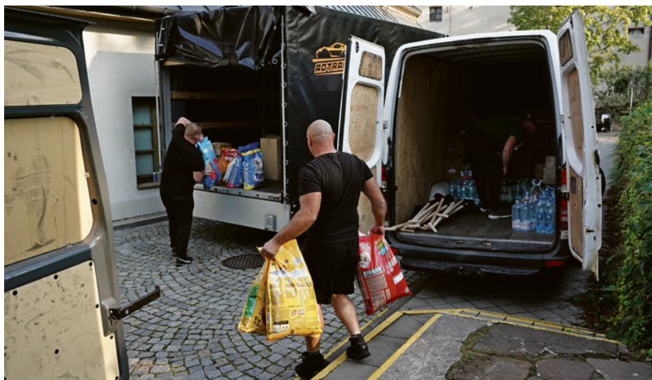
● Od 18 września codziennie z Pałacyku Zielińskiego wyjeżdżało po kilka busów wypełnionych darami przekazanymi przez mieszkańców Kielc.

Teraz zbierane są: środki dezynfekujące, chemia do sprzątania, gumowce, szczotki, wiadra, łopaty, szufle, rękawice grube gumowe, nowa odzież robocza, nowe koce i ręczniki, artykuły higieniczne. Czynne są punkty zbiórki w Pałacyku Zielińskiego oraz przy ulicy Turystycznej 1