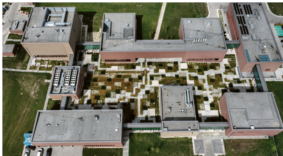
● Świętokrzyski Kampus Laboratoryjny Głównego Urzędu Miar to osiem budynków. Działanie wzorowany jest na greckiej agorze, gdzie będą się spotykali naukowcy.