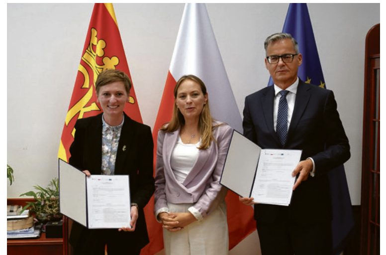
● W uroczystym podpisaniu umowy udział wzięła, minister funduszy i polityki regionalnej Katarzyna Pełczyńska-Nałęcz (w środku).

Kielce stawiają na ekologiczne projekty w zakresie energooszczędnego oświetlenia czy zazieleniania miasta. To w dzisiejszych czasach jeden z priorytetów,