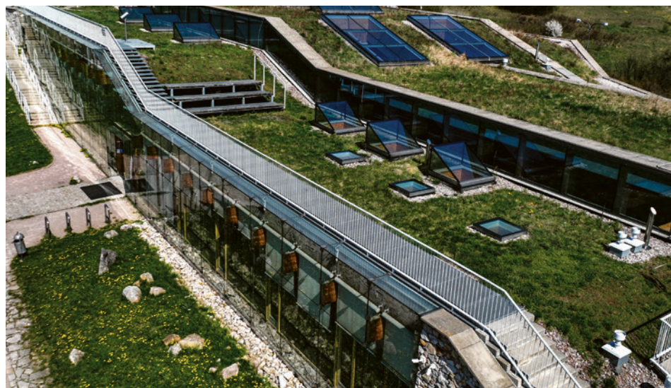
● Na dachu Centrum Geoedukacji trenerzy poprowadzą zajęcia z jogi.