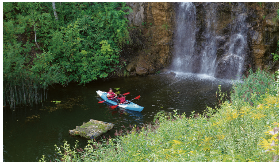
● W Parku Kadzielnia na Jeziorze Szmaragdowym znów dostępne będą kajaki.