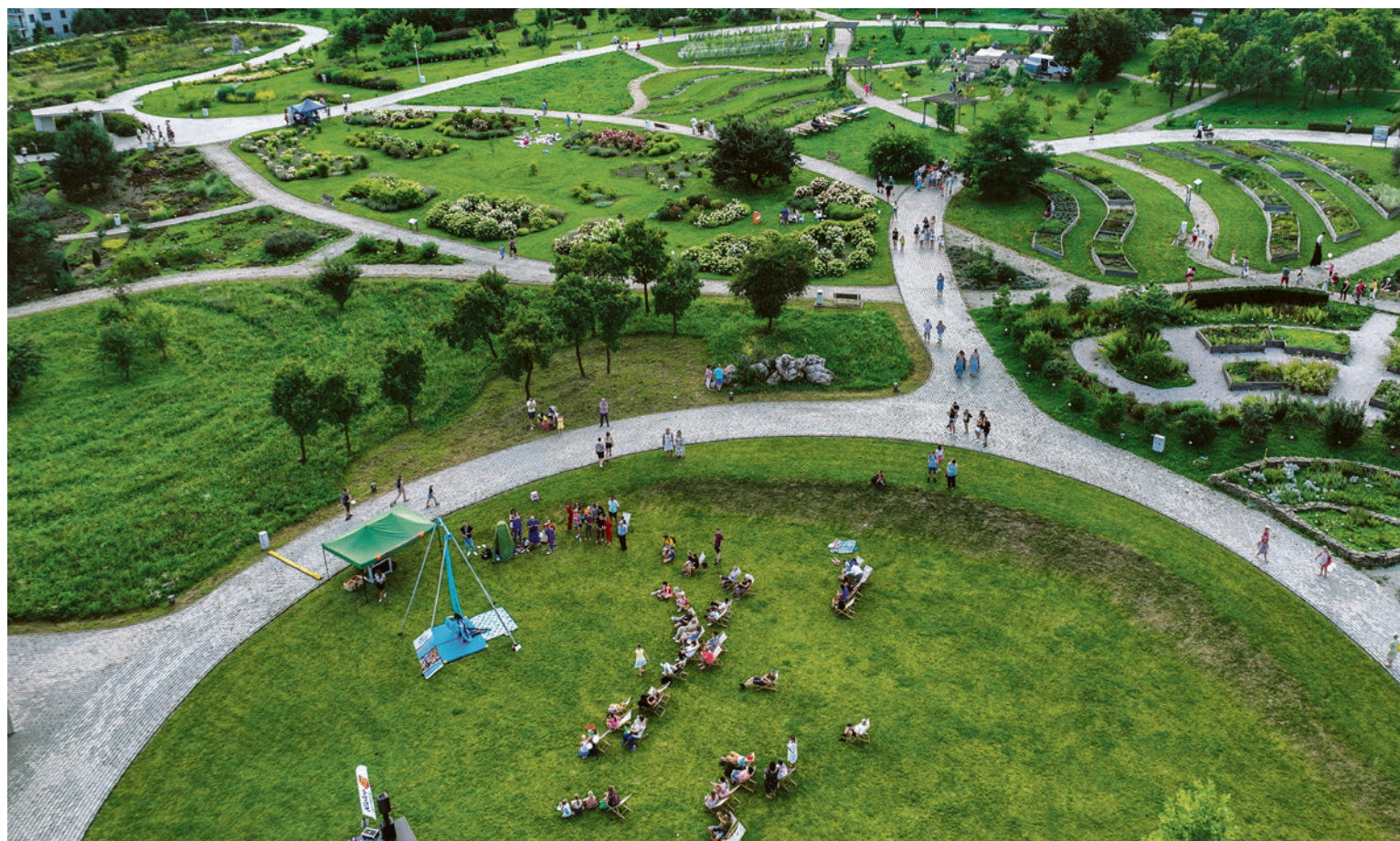
● Ogród Botaniczny wypełnią pokazy, warsztaty, animacje i spektakle dla dzieci.

W Ogrórze Botanicznym gości witać będą postacie ze spektakli Kieleckiego Teatru Tańca i Teatru Lalki i Aktora „Kubuś”. Najmłodszy będą mogli spotkać się m.in. z Wilkiem i Czerwonym Kapturkiem czy Syrenką Ariel lub wziąć udział w eksperymentach Profesora Pytalskiego. Starsi geofestiwaliowicze zagłębią się w świat