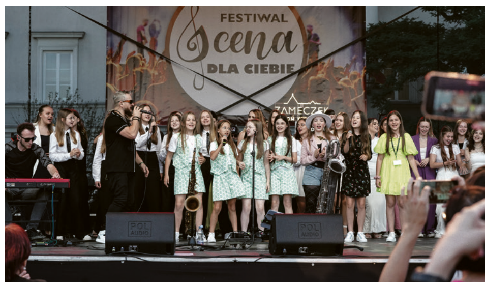
● W niedzielę kielecki Rynek należał do Domu Kultury „Zameczek”. Tam odbył się koncert finałowy Festiwalu „Scena dla Ciebie” połączony z wręczeniem nagród laureatom.