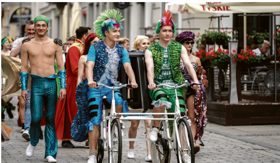
● Barwne korowód dzieci i młodzieży Szkoły Kieleckiego Teatru Tańca oraz artystów KTT w kostiumach ze spektaklu „Syrenka Ariel” przeszedł ul. Sienkiewicza do Parku Miejskiego.