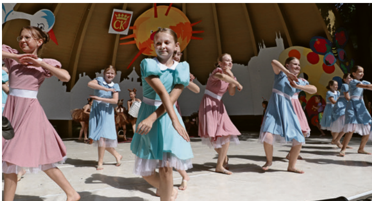
● W muzyce koncertowej Miejskiego Parku wystąpili podopieczni Młodzieżowego Domu Kultury w Kielcach.