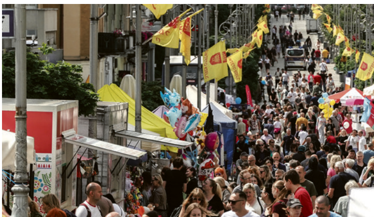
● Częścią Święta Kielc był jarmark, który jak co roku przyciągnął tłumy mieszkańców.