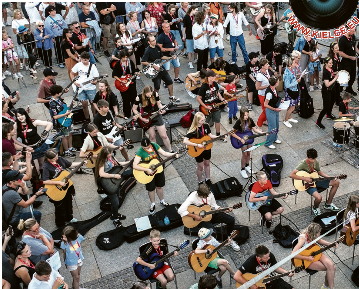
● Po raz 8. na Rynku, podczas Święta Kielc, zagrał Największy Zespół Rockowy. Po takich evergreenach, jak „Teksański”, „Nadzieja”, „Co mi Panie dasz” czy „Hi-Fi Superstar” w ubiegłych latach, tym razem na warsztat trafił „Konik na biegunach”.