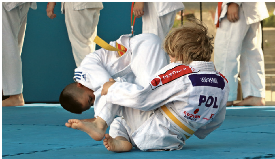
● Podczas „Sportowej Niedzieli” z Miejskim Ośrodkiem Sportu i Rekreacji na Placu Artystów swoje umiejętności prezentowali sportowcy kieleckich klubów.