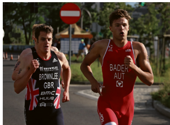
● Na linii startu w Kielcach stanął trzykrotny medalista olimpijski, Brytyjczyk Jonathan Brownlee. Był na mecie trzeci, tracąc do zwycięzcy 3 sekundy.