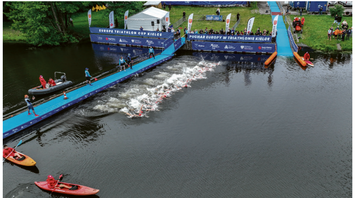
● W Zalewie Kieleckim zawodnicy pływali na dystansie 400 metrów. Wyniki badań wody pozwoliły na bezpieczne rozegranie zawodów. Ta część Pucharu Europy wzbudziła duże zainteresowanie mieszkańców.