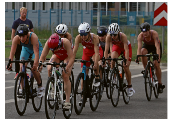
● Sportowcy do pokonania na rowerach mieli osiem kilometrów. Najważniejsze było sprawne wsiadanie na rower w strefie zmian.