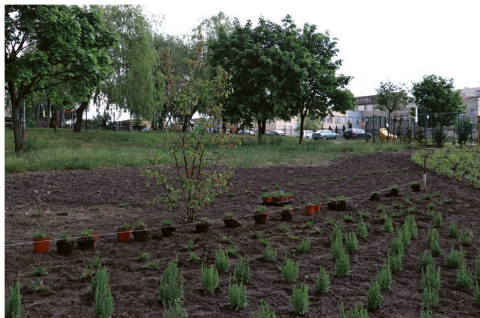
• Projekt „Zielone Płuca Kielc” realizowany jest z Budżetu Obywatelskiego. W nowym parku kieszonkowym posadzonych zostanie 2890 sztuk roślin, w tym 19 drzew.

T rwa wiosenny etap nasadzeń w miniparku, który powstaje obok wybiegu dla psów.