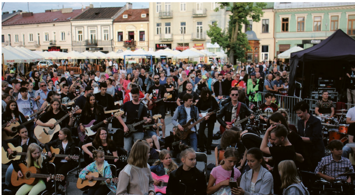
● Jak co roku na Rynku zarówno amatorzy, jak i doświadczeni muzycy wspólnie stworzą Największy Zespół Rockowy

Wielka fiesta rozpocznie się już w piątek, 21 czerwca. W Domu Środowisk Twórczych odbędzie się uroczyste wręczenie nagród Prezydenta Kielc za osiągnięcia w dziedzinie twórczości artystycznej oraz upowszechniania i ochrony kultury. Piątek to tradycyjnie Biała Noc i bezpłatne zwiedzanie muzeów, na które zapraszają: Galeria Współczesnej Sztuki Sacrum Dom Praczek, Muzeum Hammonda, Galeria Sztuki Współczesnej „Oranżeria”, Muzeum Historii Kielc, Galeria Sztuki Współczesnej Winda, Energetyczne Centrum Nauki oraz Wzgórze Zamkowe. Już od godz. 17 w Biurze Wystaw Artystycznych, tradycyjnie, wręczone zostaną nagrody w konkursie Przedwiośnie 2024