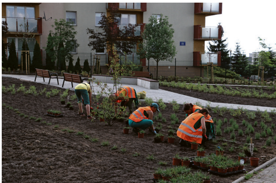
• Nowy park kieszonkowy powstaje na osiedlu Świętokrzyskim dzięki ponad dwóm tysiącom głosów mieszkańców.

W nowej zielonej enklawie, w rejonie ulic Ignacego Daszyńskiego i Marszałka Józefa Piłsudskiego, będzie można odpoczywać wśród prawie trzech tysięcy roślin. Park kieszonkowy powstaje dzięki pomysłowi i głosom mieszkańców