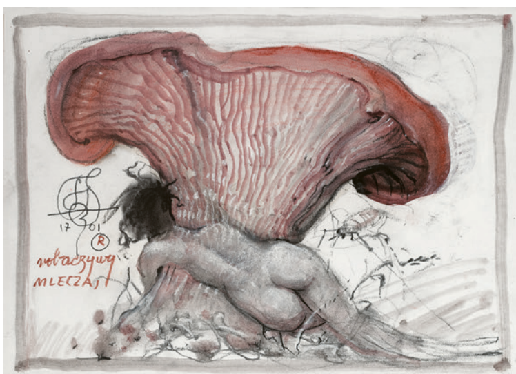
● Franciszek Starowieyski, „Robaczywy mleczaj”.