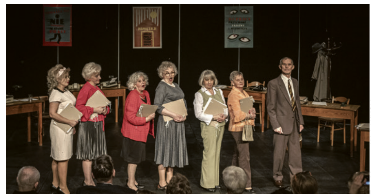
● Zespół Teatru bez Suflera podczas występu.

Opowiadania Mrożka to historie z życia pracowników spółdzielni. Nietypowe historie. Jednej pani wyrósł groch w nosie, inna walczyła z petentem, który za nic nie chciał u prezesa załatwić żadnej sprawy. Trzecia z kolei opowiadała o losach ostatniego śledzika w śmietanie i wyjaśniła, dlaczego nie zjadł go prezes. Z kolei pan musiał słono zapłacić za nakrycie prezesa w lokalu o złej reputacji. Kolejni pracownicy podnosili poprzeczkę w konkurencji „nie spóźniam się do pracy”, próbowali udowodnić, że znają języki obce i opowiadali losy służbowego kapelusza. Śmiechu było co niemiara. I wrzuseń, bo to czasy z młodości występujących aktorów. Oni znają je doskonale. Samodzielnie szykowali swoje stroje, uzupełniali