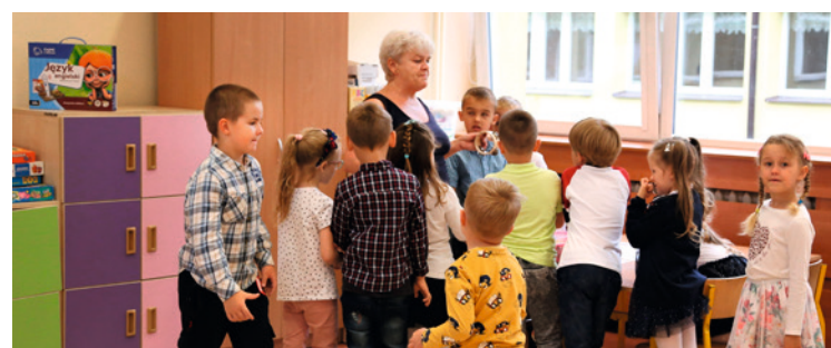
● W Kielcach działają 33 przedszkola publiczne i oddziały przedszkolne.

W rekrutacji stosowane są kryteria określone w ustawie Prawo oświatowe (Dz. U. z 2023 r., poz. 900 ze zm.) art. 131 ust. 2. Dotyczą one m.in.: wielodzietności rodziny, niepełnosprawności kandydata lub rodziców, istnienia rodzinstwa, samotnego wychowywania dziecka lub objęcia pieczęcią zastępczą. Więcej informacji na