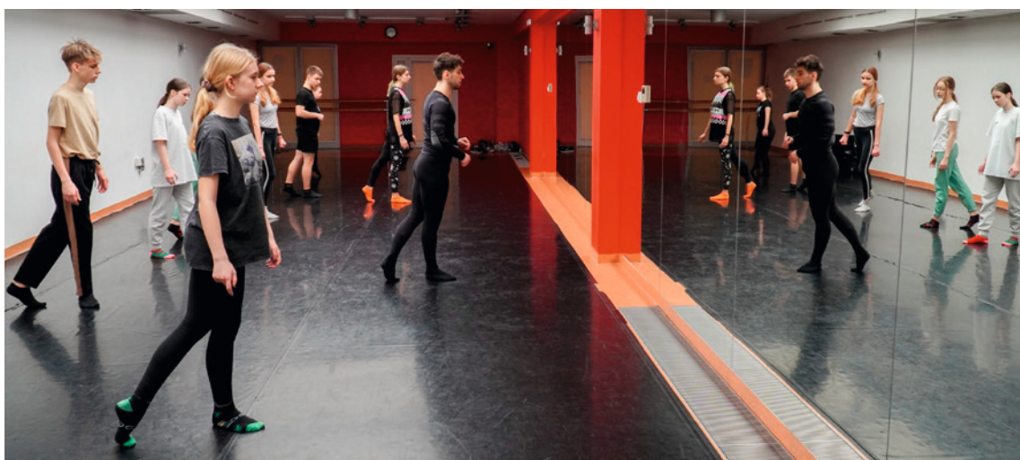
● Kielecki Teatr Tańca w czasie zimowych ferii zaprasza dzieci i młodzież na bezpłatne zajęcia taneczne.