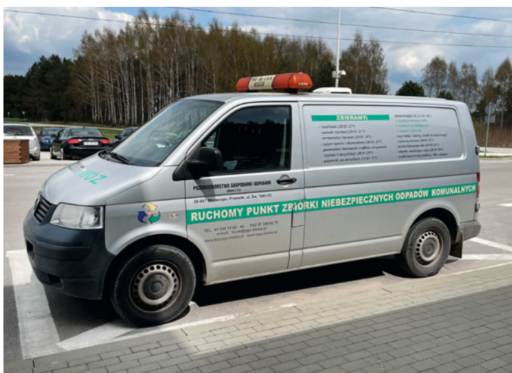
● Zbiórkę „Odrzutowozem” obsługuje Przedsiębiorstwo Gospodarki Odpadami w Promniku.

Mieszkańcy Kielc mogą oddawać do „Odrzutowozu” między innymi: świetlówki, żarówki rtęciowe, termometry rtęciowe, zużyte baterie i akumulatory, detergenty zawierające substancje niebezpieczne, pojemniki po aerozalach, opakowania po środkach ochrony roślin, środkach owadobójczych, farbach i lakierach, pozostałości farb i lakierów oraz środki do konserwacji i ochrony