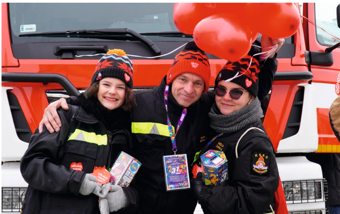
● Na strażaków zawsze można liczyć. Podczas 32. Finału druhowie z Ochotniczych Straży Pożarnych zagrają razem z Wielką Orkiestrą Świątecznej Pomocy.

Przed wszystkim żeby poczuć energię orkiestrowego grania, warto wybrać się 28 stycznia