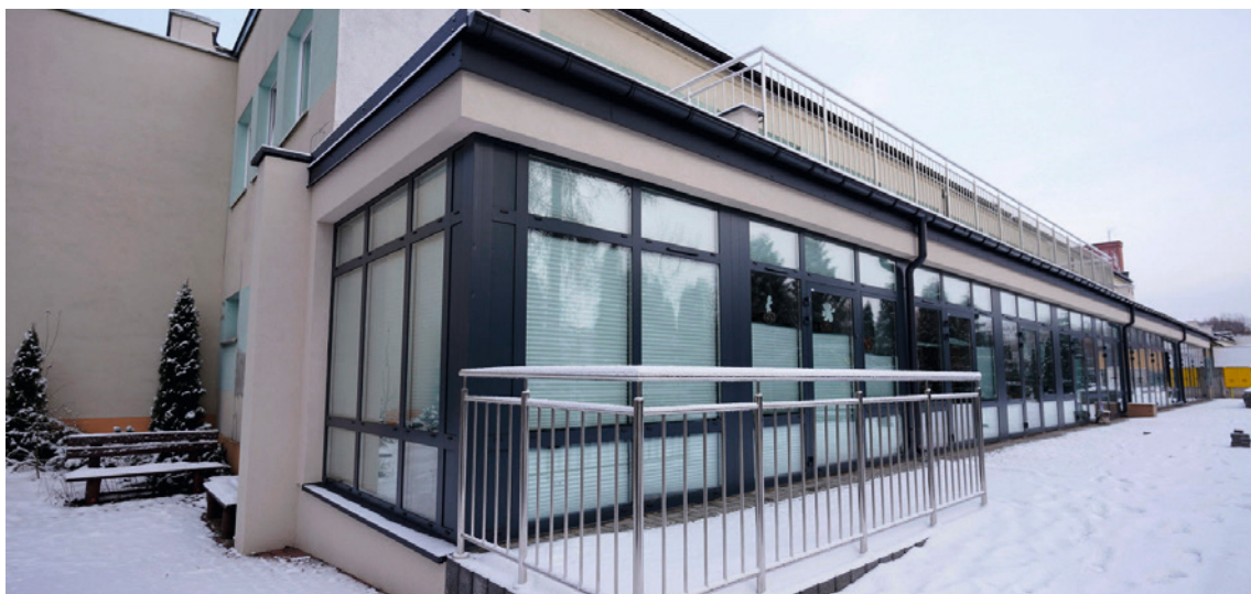
● Tak wygląda Ośrodek Rehabilitacyjno-Edukacyjno-Wychowawczy imienia Marii Majewskiej w Kielcach.