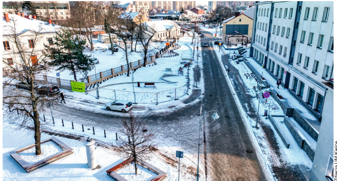
● Teraz biała, ale wiosną ul. Bodzentyńska zachwyci zielenią. Nowe elementy to fontanna, pergola, roślinność i betonowe palisady wyznaczające historyczny bieg Silniczy.

się także druga duża inwestycja, dzięki której łatwiej jest dojechać do kampusu Uniwersytetu Jana Kochanowskiego. Przebudowano skrzyżowanie al. Solidarności z al. Tysiąclecia PP oraz ulice Domaszowską i Żniwną.