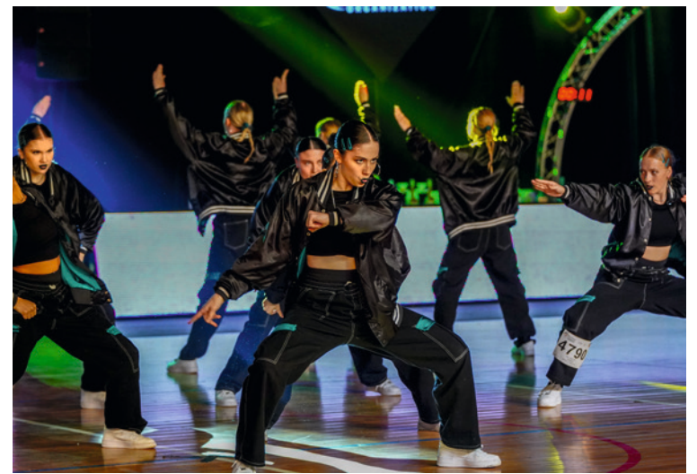
● W Kielcach odbyły się pierwsze Mistrzostwa Świata IDO Hip Hop, Popping, Hip Hop Battles i Breaking. Do miasta zjechało 4,5 tys. zawodników z 4 kontynentów.

Dzięki „Zielonej rewitalizacji zabytkowego Śródmieścia Kielc” nowe oblicze zyskują Rynek, Skwer im. Sędzimerowej, ul. Bodzentyńska wraz z placem