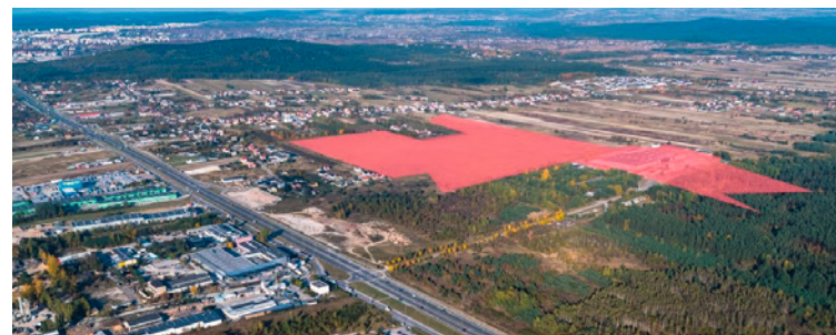
● Teren inwestycyjny przy ul. Ściegiennego to łącznie 41 hektarów powierzchni pod działalność gospodarczą.

Przedsiębiorcy mogą także skorzystać ze zwolnienia podatkowego w ramach Polskiej Strefy Inwestycji, która oferuje instrumenty wsparcia nowych inwestycji realizowanych przez przedsiębiorców na terenie całego kraju. W Kielcach poziom intensywności wsparcia należy do najbardziej atrakcyjnych w całym kraju: maksymalna intensywność pomocy publicznej dla dużych przedsiębiorstw wynosi 50%, natomiast dla średnich i małych firm zwiększa się odpowiednio o 10 i 20 punktów procentowych.