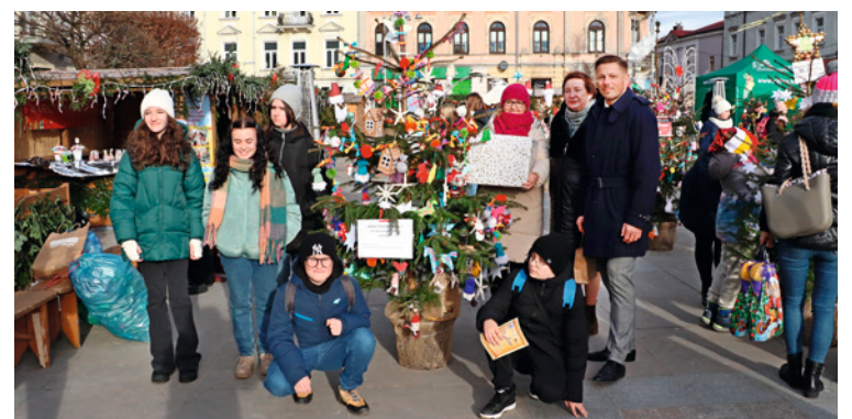
● Wybór najpiękniejszej choinki był niezwykle trudny. Pierwsze miejsce w konkursie jury przyznało uczniom Szkoły Podstawowej nr 1.