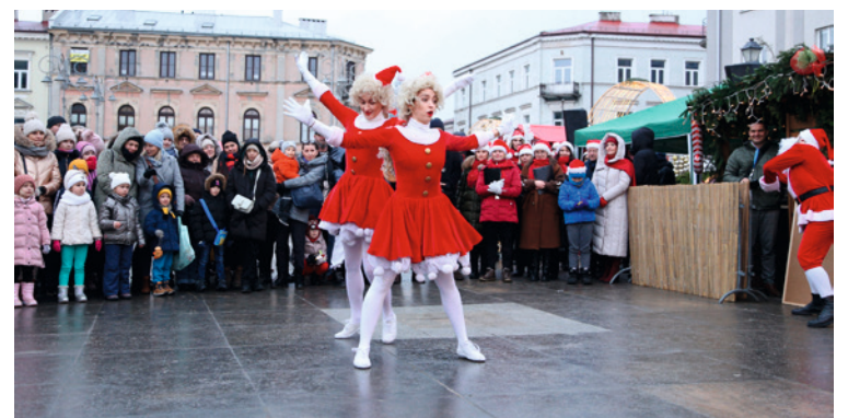
● Pokaz swoich umiejętności dali aktorzy Kieleckiego Teatru Tańca.