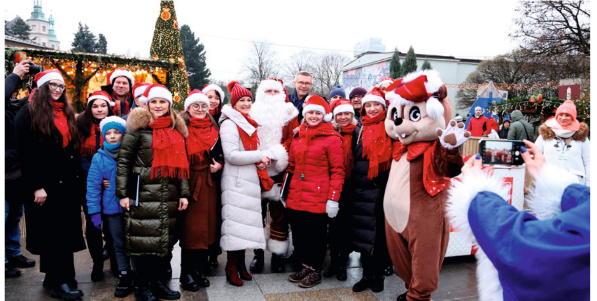
● Plac Artystów stał się centrum świątecznych wydarzeń. Kielczanie tłumnie odwiedzali centrum miasta, aby wspólnie spędzić czas. Do wspólnych zdjęć chętnie pozowały sympatyczne maskotki.

W sobotę, 16 grudnia na mieszkańców i gości od rana czekało wiele atrakcji. Dla najmłodszych przygotowano animacje i konkursy z żywymi maskotkami, a Energetyczne Centrum Nauki Industria poprowadziło warsztaty z wykonywania zawieszek. Na deptaku stanęły stragany z lokalnymi produktami, rękodziełem i świątecznymi przysmakami. Była żywa szopka z alpakami, owieczkami i królikami. Stała też tradycyjna szopka bielejska z dzieciątkiem Jezus.