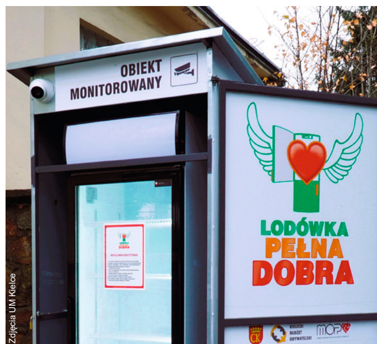
● Lodówki znajdują się przy Środowiskowym Domu Samopomocy przy ul. Miodowej 7 oraz przy Szpitalu Kieleckim przy ul. Kościuszki 25.