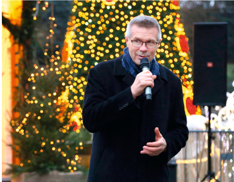
● W otwarciu jarmarku uczestniczył prezydent Kielc Bogdan Wenta, który złożył kielczanom życzenia i dziękował za organizację imprezy.

Święty Mikołaj, bajkowe postacie, występy tancerzy i wokalistów, warsztaty robienia lalek, zdobienia pierników, pakowanie prezentów, żywa szopka z alpakami i przejażdżki saniami uatrakcyjniły otwarcie Jarmarku Bożonarodzeniowego na Placu Artystów i ulicy Sienkiewicza