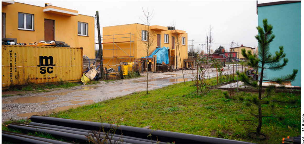
● Na osiedlu u zbiegu ulic 1 Maja, Łódzkiej i Hubalczyków, w sumie powstanie 78 lokali mieszkalnych.

Rozbudowa osiedla „Nowe Jeziorany”, powstanie mieszkań pod wynajem w budynku dawnej szkoły i na ul. Wiśniowej. Dzięki tym inwestycjom uda się zwiększyć liczbę mieszkań komunalnych i spełnić oczekiwania mieszkańców, którzy są w trudnej sytuacji