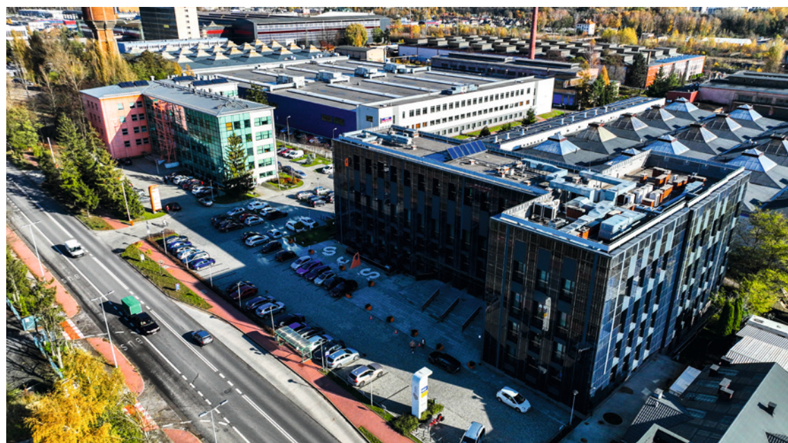
● Dzięki działalności Parku, gmina zyskała prawie 300 milionów złotych, co przyczyniło się do zrewitalizowania północnej, poprzemysłowej części miasta i uczyniło ją atrakcyjnym adresem dla biznesu.