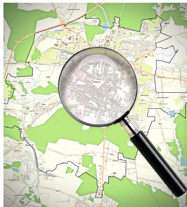
● Dane o mieście znajdziemy pod jednym adresem zoom.kielce.eu .