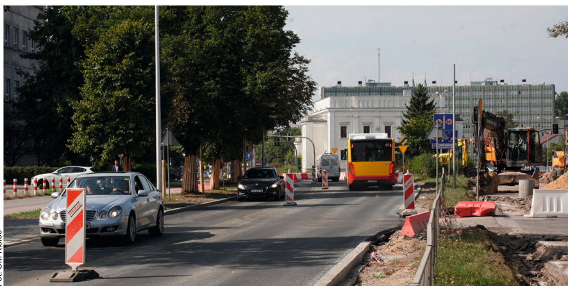
● Od soboty, 16 września, kierowcy na al. IX Wieków jeżdżą już wyremontowaną jezdnią. Zakończenie prac jeszcze w tym roku.

Obecnie realizowane są dwa zadania – al. IX Wieków Kielc i część ul. Śniadeckich, między Prosta i Seminaryjską. Na pierwszej z nich wykonawca zakończył