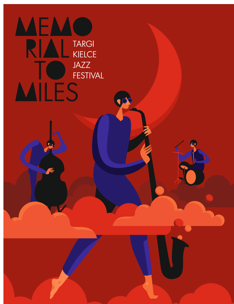
Festiwal Memorial to Miles Targi Kielce Jazz Festival otrzymał dofinansowanie w wysokości 35 tys. zł z programu „Muzyka” Ministerstwa Kultury i Dziedzictwa Narodowego. Partnerem wydarzenia są Targi Kielce

Festiwal Memorial to Miles 21-24 września - bilety na pojedyncze dni i karnety na cały festiwal można kupić w kasie KCK lub na www.kck.bilety24 . Karnet kosztuje 199 zł, bilety na pojedyncze koncerty i dni od 49 zł.