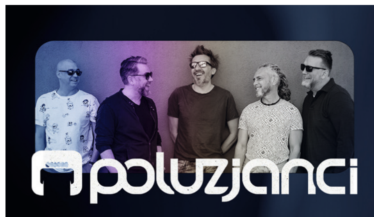
● Poluzjanci wystąpią 15 października w Kieleckim Centrum Kultury.

15 października 2023, godz. 19. Bilety 110-150 zł. Do nabycia na kck.bilety24.pl oraz w kasie KCK