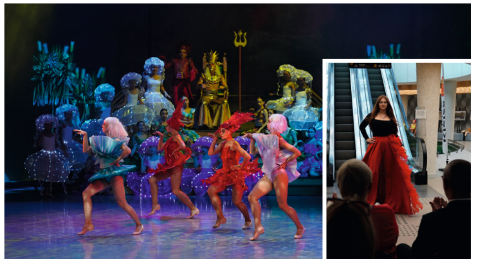
● Premierą spektaklu Kieleckiego Teatru Tańca „Syrenka Ariel” uroczystie zainaugurowano w Kielcach III edycję Festiwalu Wiatru. W ramach wydarzenia, dzień później, w sobotę 16 września, na Dworcu Autobusowym przy ul. Czarnowskiej, odbył się „Zwiczny Wieczór ze Sztuką i Modą”.