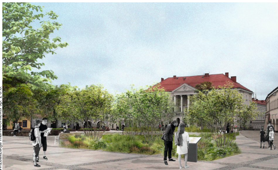
Wizualizacja mamaArchitekci sp. z o.o.

Na ulicy Bodzentyńskiej wykonano już komorę fontanny i palisadę ukazującą historyczny przebieg Silnicy. Na al. IX Wieków Kielc przed dawną synagogą trwa przesadzanie zieleni. Jeszcze w wakacje ruszą prace na skwerze Sendlerowej. We wrześniu zaczną się zmiany na Rynku