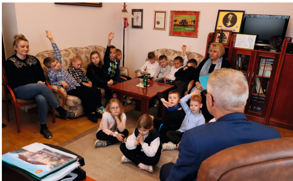
• W czasie lekcji samorządowych i spotkania z prezydentem Bogdanem Wentą młodzież kielczanie pytali np. czy prezydent był grzecznym dzieckiem i czy lubił się uczyć.

W tym roku w Kielcach Dzień Dziecka potrwa dłużej niż zwykle. Miejskie jednostki, które na co dzień dbają o potrzeby dzieci i młodzieży przygotowały specjalną ofertę łączącą edukację i dobrą zabawę