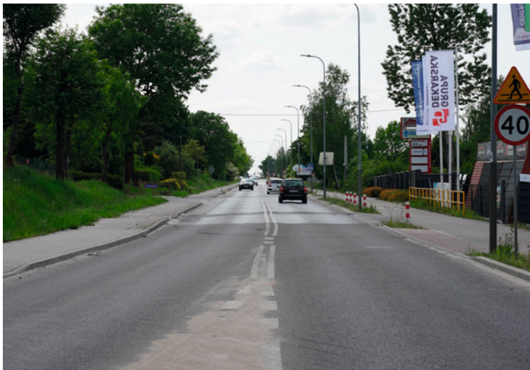
● Zmodernizowany zostanie odcinek ul. Warszawskiej o długości 600 metrów, od ronda Geodetów do mostów na Silnicy.