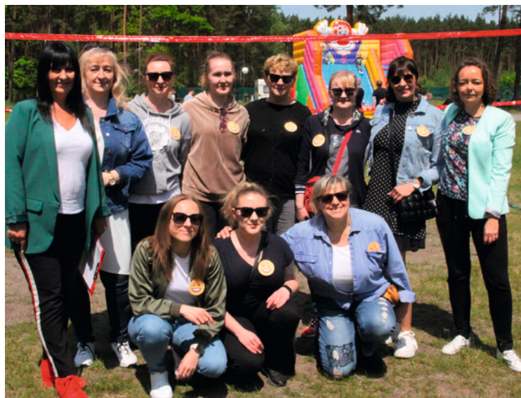
● Ekipa Ośrodka Rodzinnej Pieczy Zastępczej. To oni dbają o rodziny zastępcze z Kielc.