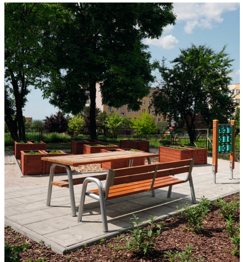
● Skwer przy Przedszkolu numer 19 na Osiedlu Na Stoku podzielony jest na różne strefy.