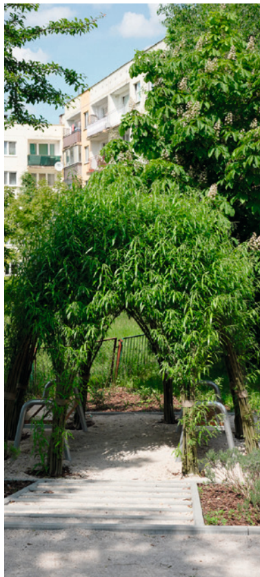
● Wierzbową altanę w nowym zielonym zakątku.