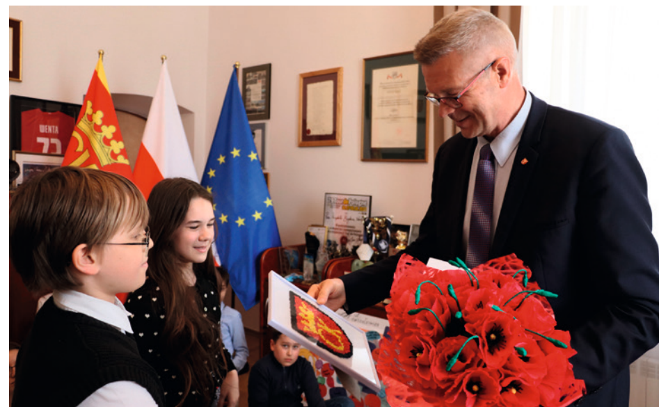
• Dzieci i młodzież w czasie lekcji samorządowych w Urzędzie Miasta przekazują też prezydentowi wykonane przez siebie bardzo ciekawe prace.

A trakcje czekają m.in. w Muzeum Zabawek i Zabawy, Pałacyku Zielińskiego i na Stadionie Miejskim. Z myślą o dzieciach powstał też nowy projekt pn. „Kielce - to my”.