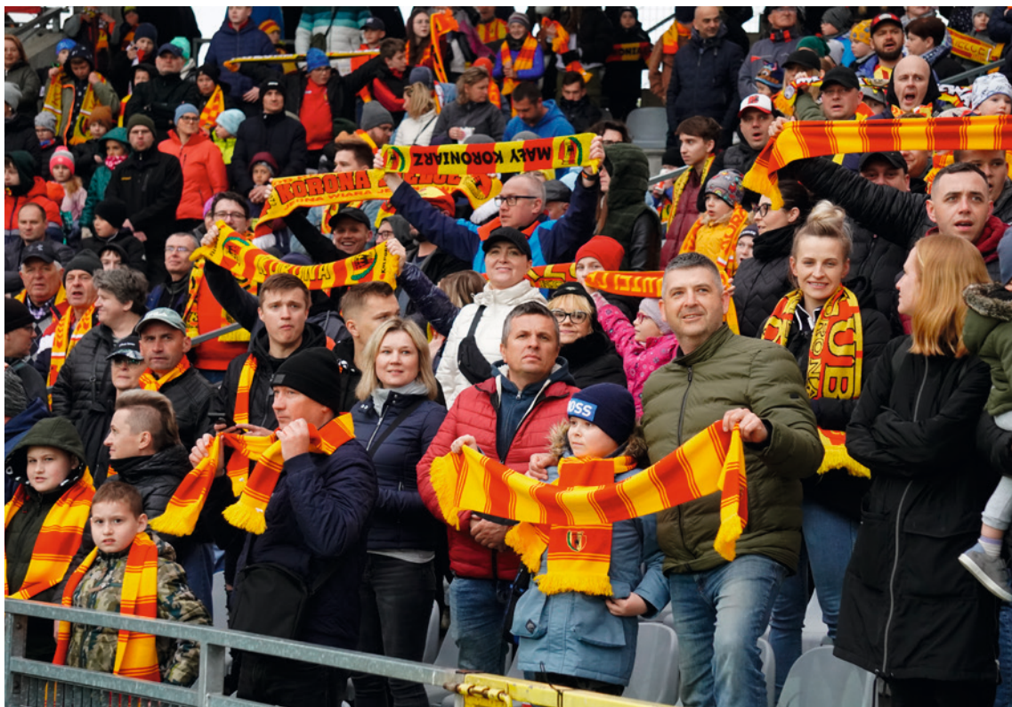
● Łączna frekwencja ponad 171 tys. kibiców to najlepszy wynik w historii klubu.