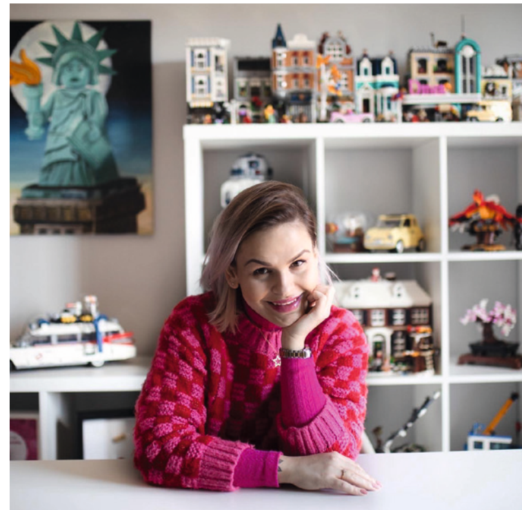
● Popularna wśród dzieci i młodzieży legotuberka Ciocia od Klocków spotka się z fanami w czasie KloCKi Fest.

Inicjatorami KloCKi Fest – Złotu Legotuberów są: Targi Kielce, Muzeum Zabawek i Zabawy w Kielcach oraz Spółdzielnia Socjalna Tropem Przygody.