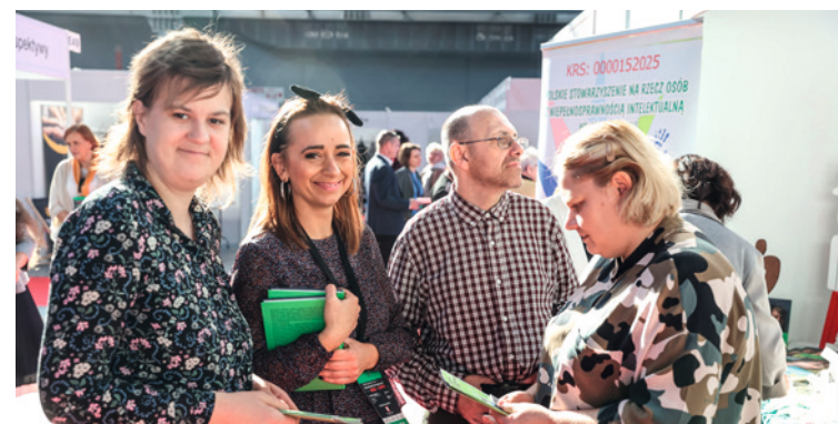
● Targi organizacji pozarządowych NGO-EXPO to miejsce spotkań stowarzyszeń i fundacji działających na rzecz osób potrzebujących wsparcia z całego kraju.

Wystawcy zajmą dedykowane zakresem działań miejsca. Swoją strefę będą miały ochotnicze straże pożarne, koła gospodyń wiejskich, podmioty zajmujące się sportem, kulturą, ochroną środowiska, zdrowym stylem życia, pracą z młodzieżą, niepełnosprawnymi. Stoiska przygotują m.in. Polski Czerwony Krzyż, Fundacja Nadzieja Rodzinie wspierająca osoby bezrobotne