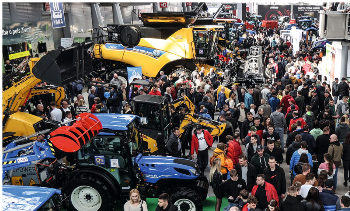
● Targi rolnicze Agrotech to najchętniej odwiedzana impreza w Targach Kielce. Marcowa edycja przyciągnęła blisko 70 tysięcy osób.

Pawilonów brakuje także na targi rolnicze Agrotech, które już przed laty zyskały miano największej wystawy w halach, w Polsce pośród wszystkich branż. Od 2005 roku (za wyjątkiem pandemii) dobudowywane są hale tymczasowe - na