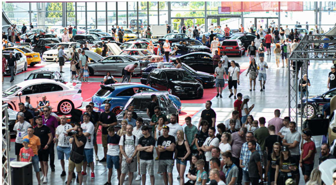
● Mubi Dub It Tuning Festival to setki pięknych aut w jednym miejscu.