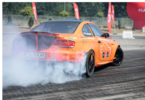
● Atrakcją imprezy będą między innymi pokazy driftu i przejażdżka DRIFT TAXI.