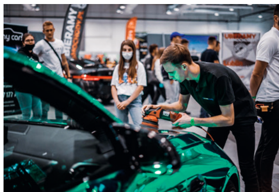
● Warsztaty i porady fachowców od autodetailingu czekać będą podczas Mubi Dub It Tuning Festival.

Giełda klasyków to obowiązkowy punkt czerwcowego Festiwalu Mubi Dub It! Znaleźć można tu niemal wszystko: od drobnych gadżetów reklamowych z czasów słusznie minionej epoki, przez rowery Jubilat wyciągnięte z szopy stryjskiego, aż po wysokiej klasy zabytkowe auta z naklejką „sprzedam”. Wyjątkowe pojazdy przyciągające wzrok fanów motoryzacji i towarzyszące im piękne hostessy to tylko część corocznego święta tuningu.