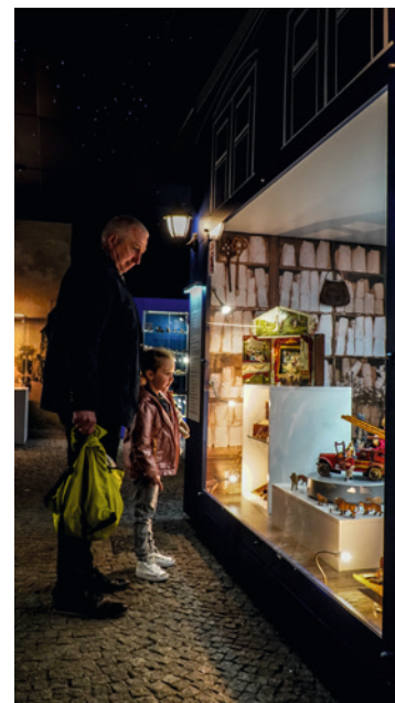
● Muzeum Zabawek i Zabawy łączy pokolenia.