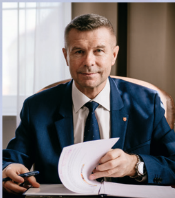
Bogdan Wenta prezydent Kielc

O wszystkich inwestycjach, które powstały dzięki środkom UE można przeczytać na www.kielce.eu .