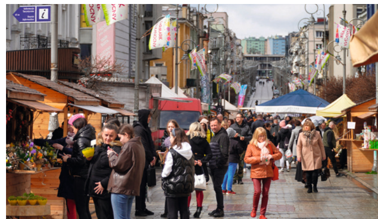
● Mimo nie najlepszej pogody Jarmark Wielkanocny cieszy się dużym zainteresowaniem. Stoiska na ulicy Sienkiewicza będą czynne do 7 kwietnia.