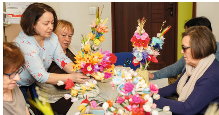
● W Klubie Seniora przy ul. Naruszewicza przygotowywanie palm wielkanocnych trwa od kilku miesięcy.

Tłumy gości, gwar, śmiechy, naprawdę mokry śmigus-dyngus i czas oczekiwania. Tak Panie