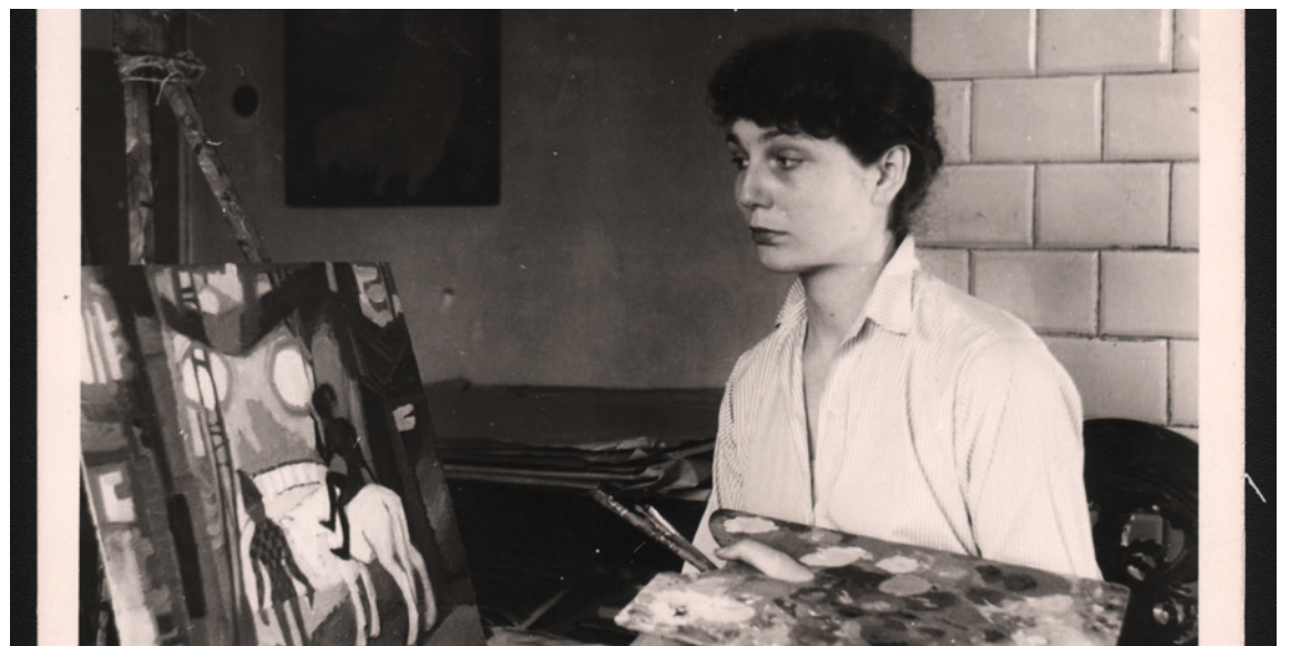
● Zdjęcie Jadwigi Trzcińskiej pochodzące ze zbiorów Muzeum Historii Kielc.

Jej prace znajdują się w zbiorach Muzeum Narodowego w Warszawie, Muzeum Narodowego w Kielcach, Biblioteki Narodowej i zbiorach prywatnych.