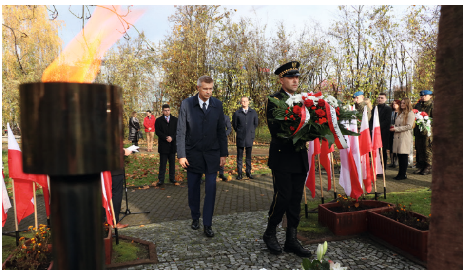
● Prezydent Bogdan Wenta w czasie uroczystości 83. rocznicy tragicznej śmierci Stefana Artwińskiego, prezydenta Kielc zamordowanego przez Niemców w czasie II wojny światowej.