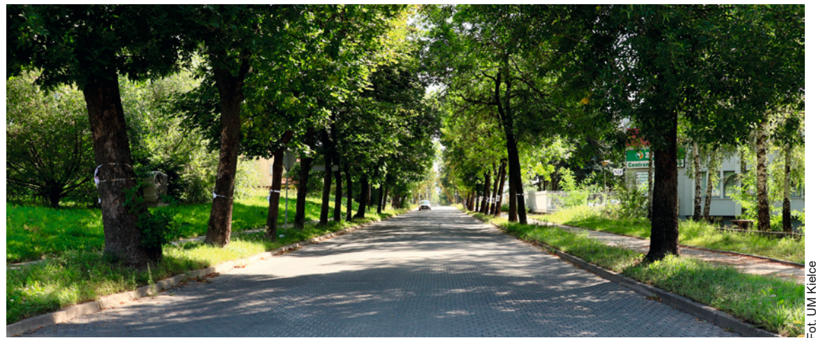
● Miasto reaguje na apele mieszkańców. Zmienia założenia projektowe przebudowy skrzyżowania ulic Jagiellońskiej, Karczówkowskiej i Kamińskiego, aby ograniczyć wycinkę drzew.