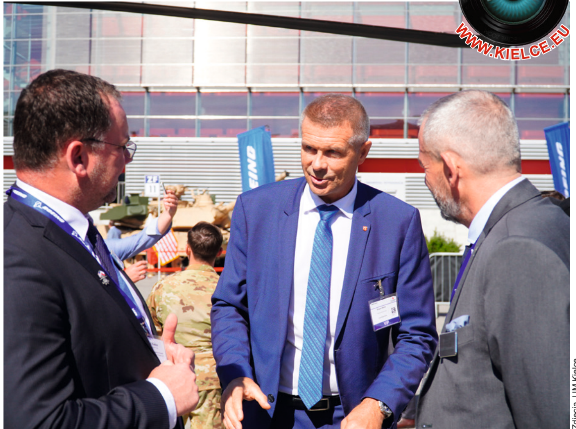
● Prezydent Kiel Bogdan Wenta uczestniczył w rekordowym 30. Międzynarodowym Salonie Przemysłu Obronnego w Targach Kielce, który był okazją do wielu rozmów i spotkań. Prezydent Wenta wziął także udział we wręczeniu nagród Defender - ostatnim akcencie tegorocznej edycji jubileuszowego MSPO.