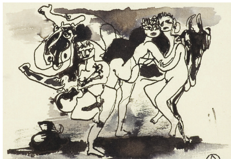
● Na wystawie obok obrazów i rysunków będą także kostiumy i projekty scenografii Ottona Axera.