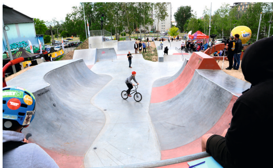
• W niespełna miesiąc po otwarciu na SkatePark Kadzielnia odbyły się pierwsze w kraju Mistrzostwa Polski BMX Freestyle Park. Obiekt cieszy się dużą popularnością wśród kielczan.

O osoby, które nie mają telefonu komórkowego lub dostępu do internetu, mogą zgłaszać w 15 punktach na terenie miasta.