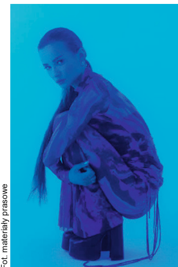
● Natalia Szroeder

Swoją trasę koncertową Natalia Szroeder zainauguruje w Kielcach w sobotę 15 października o godz. 19. Bilety na koncert można kupić w kasie KCK, na stronach: kupbilecik.pl , a także kck.bilety24.pl i e-bilet.pl . Bilety kosztują 59 i 79 zł.