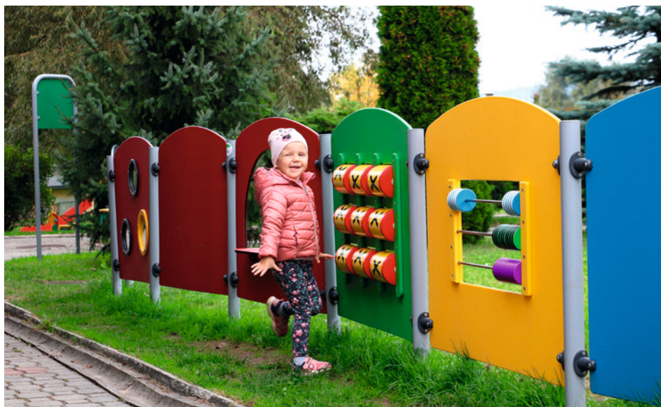
• Dzieciaki mogą korzystać już z nowych atrakcji - paneli edukacyjnych, huśtawek i bujaków - na placu zabaw przy Przedszkolu Samorządowym nr 19 na osiedlu Na Stoku.

W tym roku mieszkańcy mogą wybierać spośród 131 projektów. Głos można oddać wyłącznie elektronicznie za pomocą formularza dostępnego na stronie bo.kielce.eu . Łącznie na realizację wszystkich projektów przeznaczono w tym roku 8 milionów złotych!