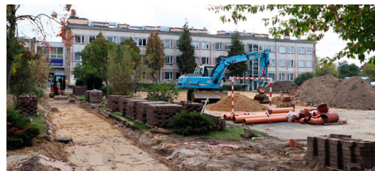
• Przy Zespole Szkół Informatycznych trwa budowa boisk i wiat na potrzeby klas outdoorowych. Inwestycja także powstaje w ramach KBO.

Urząd Miasta zachęca także wnioskodawców do promowania projektów, które zostały dopuszczone do głosowania, w formie krótkich