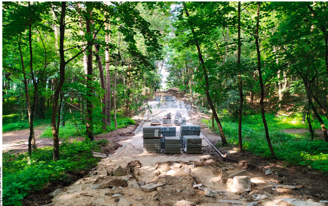
● W Parku Baranowskim trwa remont schodów. Inwestycja będzie kosztowała 300 tysięcy złotych.

Prace brukarskie Zieleni Miejska prowadzi również na zlecenie Wydziału Gospodarki Komunalnej i Środowiska UM Kielce. Najważniejszą tego typu inwestycją jest budowa schodów