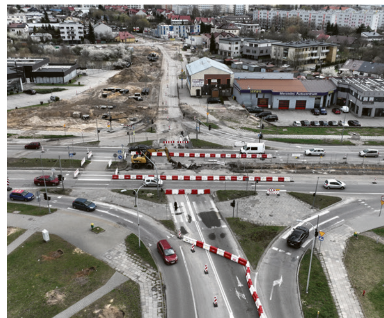
● Trwa remont na al. Solidarności. Równolegle z pracami wykonywanymi przez drogowców, budowana jest nowa sieć ciepłownicza.

- Ma ona na celu zapewnienie bezpieczeństwa energetycznego mieszkańcom os. Czarnockiego i kilkudziesięciu wspólnotom zasilanym obecnie z ciepłowni Kieleckiej Spółdzielni Mieszkaniowej, a już w nowym sezonie grzewczym mających pobierać