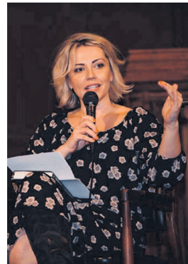
● Dagmara Domińczyk podczas spotkania ze swoimi fanami.

Aktorka poznała Patricka już na studiach, ale zaiskrzyło między nimi wiele lat później. Twierdzą, że są swoimi przeciwnieństwami: wybuchowa, energiczna Dagmara i stateczny, opanowany Patryk. Tworzą zgraną, kochającą się rodzinę, przestrzegając zwyczajów i tradycji zarówno polskich, jak i amerykańskich. W grudniu ubiegłego roku dołączył do nich jeszcze uroczy psiak, szczeniak, którego synowie nazwali Eddie Van Wilson.