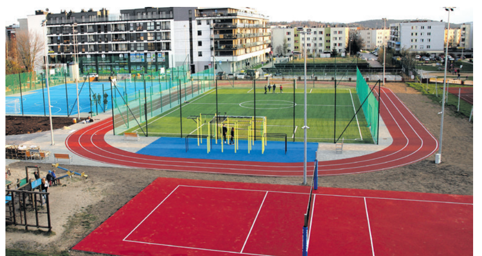
● Jedną z ostatnich dużych inwestycji budżetu obywatelskiego, budowa kompleksu sportowego na osiedlu Ślichowice, jest już na ukończeniu prac.