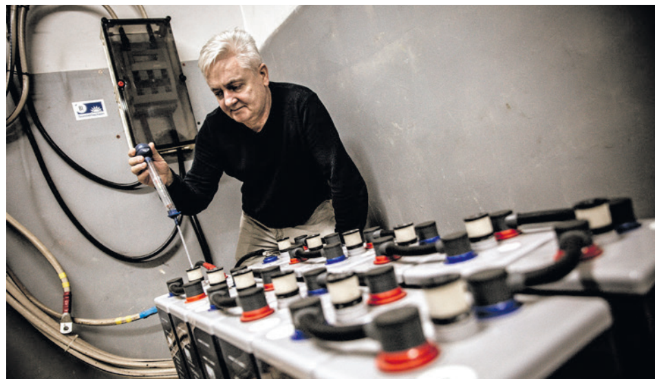
● Ogromne akumulatory gwarantują, że w przypadku awarii prądu zadziała oświetlenie ewakuacyjne przy Małej i Dużej Scenie KCK. Dlatego ich sprawność jest regularnie sprawdzana.