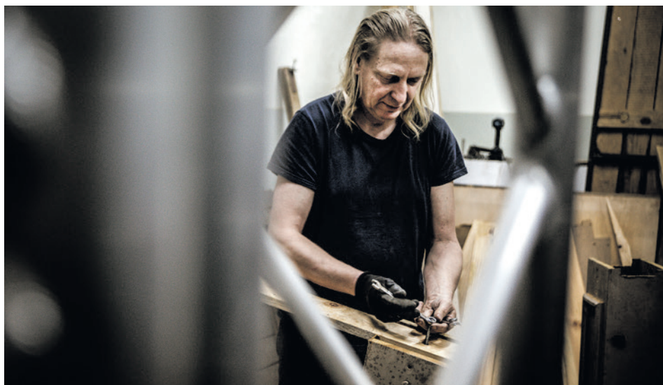
● Elementy scenografii w Kieleckim Centrum Kultury zajmują dużo miejsca. Gdy już nie są potrzebne, można je rozebrać na części i... wykorzystać ponownie. To ekologiczne i ekonomiczne.