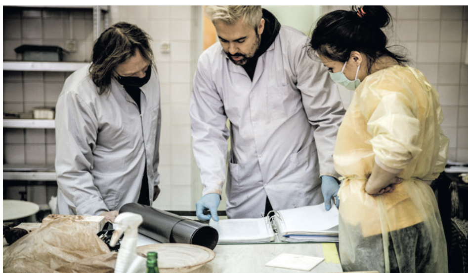
● By opanować technikę, trzeba wielu godzin nauki. Szkolenia ceramiczne dla pracowników Kieleckiego Centrum Kultury trwają mimo lockdownu.