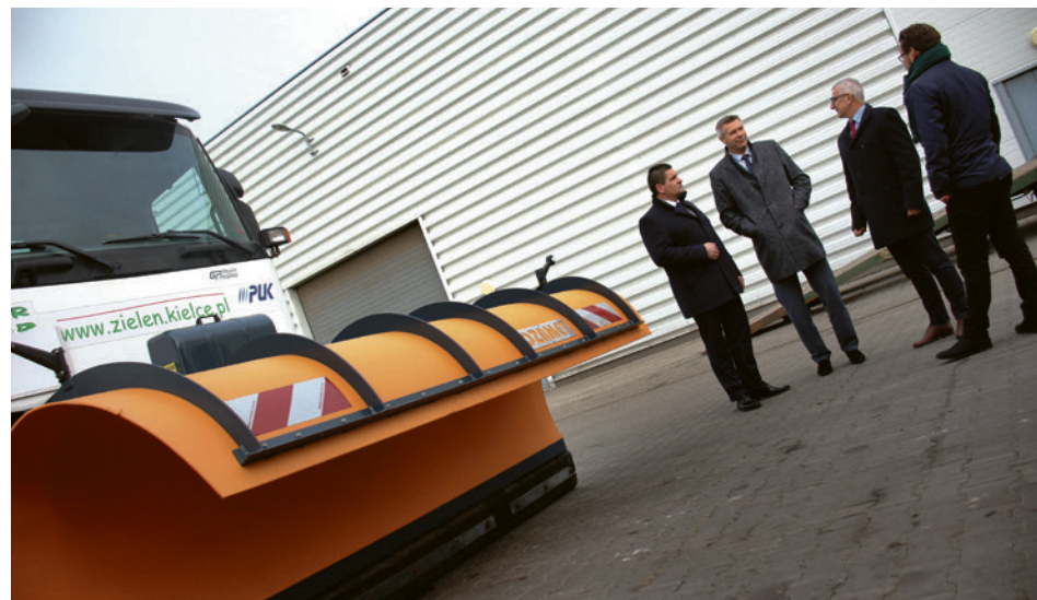
● Miasto gotowe na zimę. Nowy sprzęt do odśnieżania w Rejonowym Przedsiębiorstwie Zieleni i Usług Komunalnych oglądał Prezydent Bogdan Wenta.