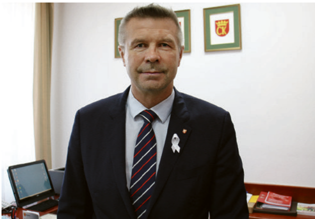
● Stop przemocy wobec dzieci! 25 listopada rozpoczęła się XVI Kampania Białej Wstążki.