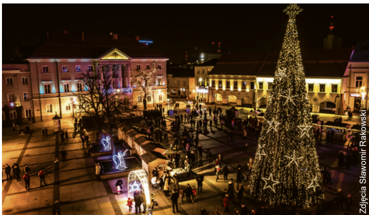
● Jarmark w 2019 roku cieszył się sporym zainteresowaniem kielczan.

Prezydent Miasta Kielce serdecznie zaprasza na tegoroczny Jarmark Bożonarodzeniowy, współorganizowany przez miejskie instytucje kultury oraz jednostki miasta.