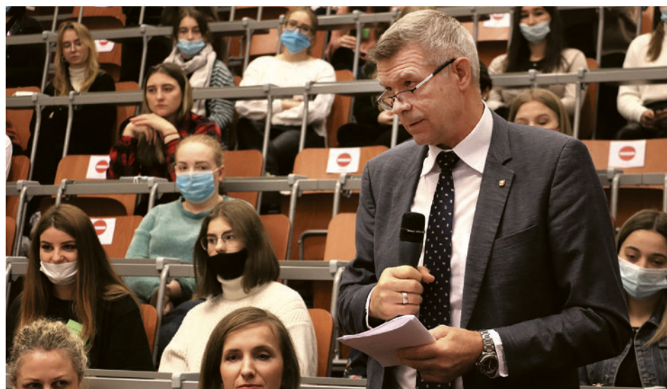
● Z okazji Światowego Dnia Przedsiębiorczości Kobiet, prezydent Bogdan Wenta spotkał się ze studentkami Uniwersytetu Jana Kochanowskiego w Kielcach.