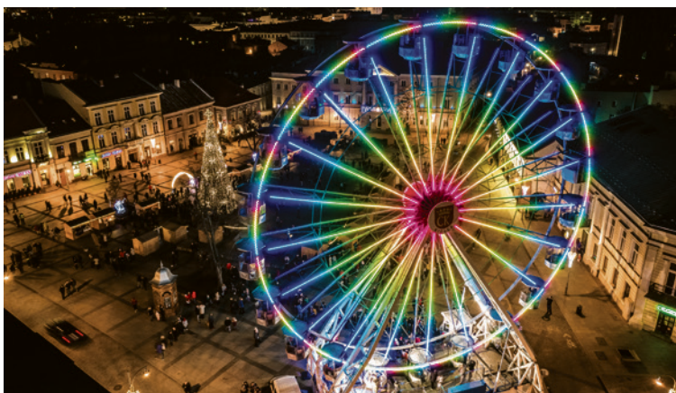
● W tym roku przy okazji Jarmarku Bożonarodzeniowego, na kieleckim Rynku ponownie pojawi się koło widokowe.