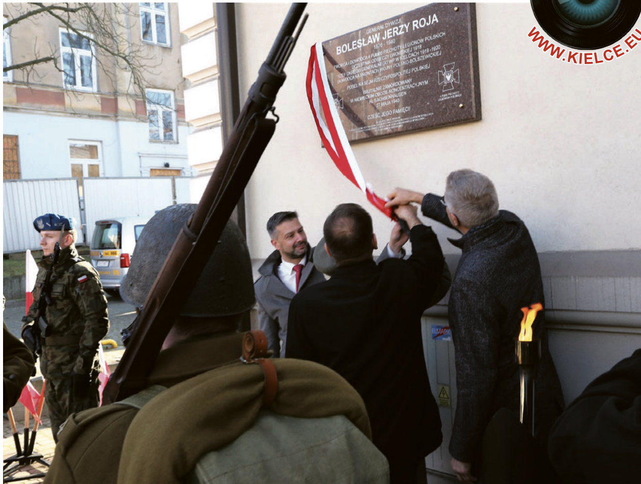
● Na dawnym budynku 2. Dywizji Piechoty Legionów, obecnej siedzibie Biura Wystaw Artystycznych, odsłonięto tablicę poświęconą generałowi Bolesławowi Roi - legendarnemu dowódcy Wojska Polskiego.