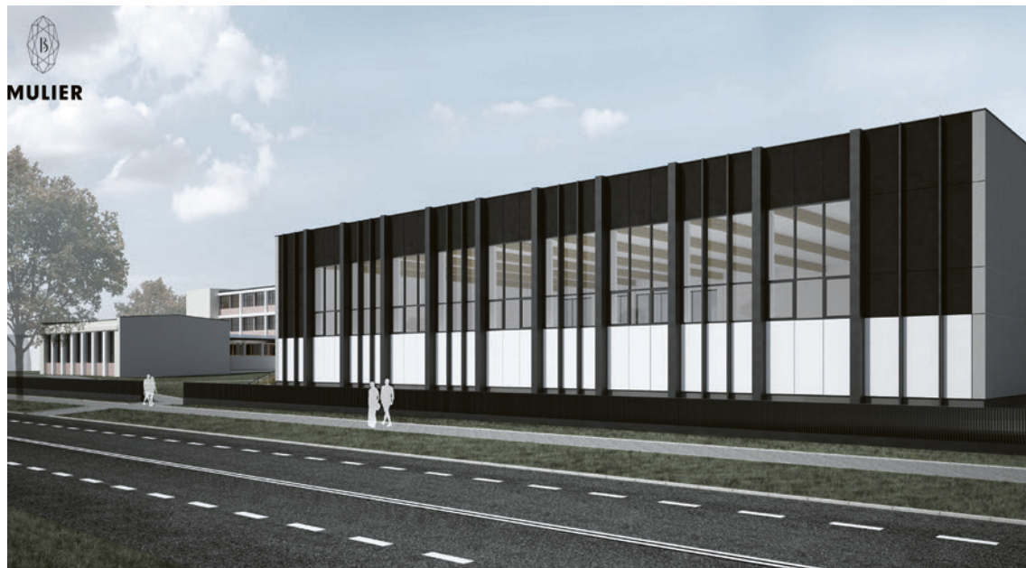
● Na nowoczesną halę sportową uczniowie I Liceum Ogólnokształcącego im. Stefana Żeromskiego czekali od lat. Jej budowa rozpocznie się w przyszłym roku.

Inwestycje powstaną nie tylko na głównych ulicach Kielc. W planach jest między innymi budowa infrastruktury drogowej