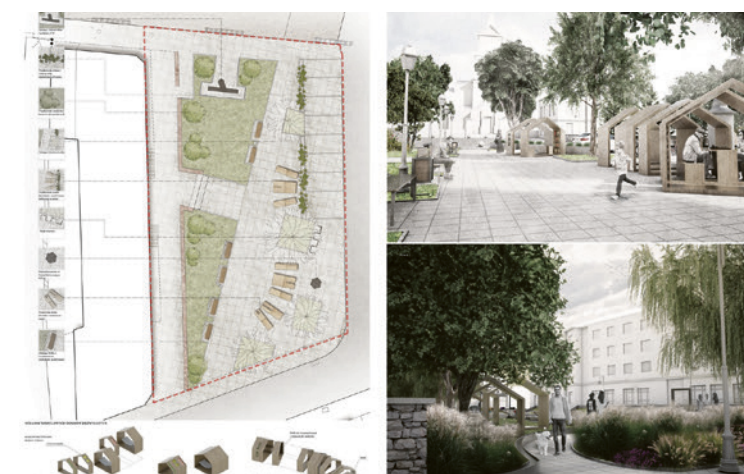
● Na Bodzentyńskiej pojawi się strefa relaksu i miejsca wypoczynku dla dzieci oraz dorosłych.