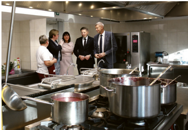
● W Szkole Podstawowej nr 8 gotowa jest już nowoczesna kuchnia i stołówka, którą odwiedzili prezydent i jego zastępcy.