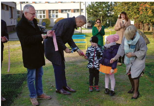
● Prezydent Bogdan Wenta wraz z dziećmi ze SP nr 34 otworzył plac zabaw, który powstał w ramach budżetu obywatelskiego.