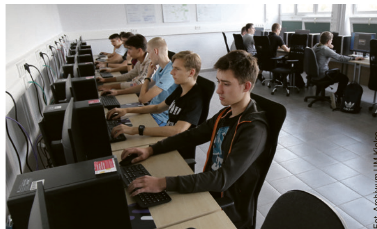
● Nowa pracownia informatyczna w Zespole Szkół Elektrycznych, wyremontowana i doposażona w sprzęt w ramach projektu.

- Bardzo się cieszymy, że pozyskane przez Biuro ds. Przedsiębiorczości i Centrum Obsługi Inwestora dofinansowanie pomaga młodym ludziom w zdobywaniu ważnych, praktycznych umiejętności informatycznych, niezbędnych na rynku pracy. Branża IT jest bardzo ważnym sektorem w Kielcach. Wierzymy, że pomagając uczniom już na etapie nauki szkolnej, kształtujemy kadry dla inwestorów - mówi Bogdan Wenta, prezydent Kielc.