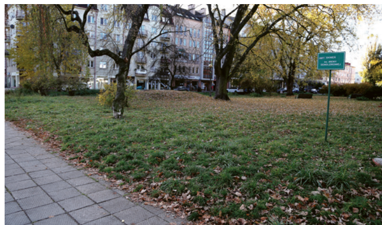
● Tak obecnie wygląda skwer Ireny Sendlerowej...