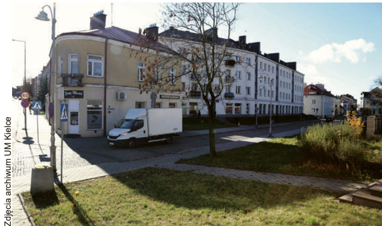
● Rewitalizacja obejmie między innymi ulicę Bodzentyńską.