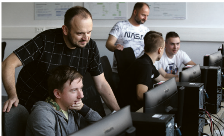
● Uczniowie z ekspertami podczas nauki programowania w Zespole Szkół Elektrycznych.

Stażyci za swoją pracę otrzymali stypendium. Realizacja tych zawodowych praktyk współfinansowana jest przez Unię Europejską, w ramach realizowanego w Biurze ds. Przedsiębiorczości i Centrum Obsługi Inwestora projektu pn.