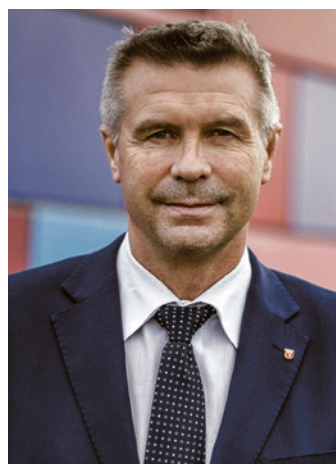
Bogdan Wenta prezydent Kielc

Od godz. 12:40 przewidziano m.in. podniesienie Flagi Państwowej, odegranie Hymnu, przemówienia władz, wręczenie mianowań na wyższe stopnie wojskowe, salwę honorową, złożenie kwiatów i zniczy, wspólne odśpiewanie Pieśni Reprezentacyjnej Wojska Polskiego: „Marsz Pierwszej Brygady”, defilada pododdziałów przed pomnikiem i trybuną honorową, krótki koncert w wykonaniu orkiestry oraz pokaz musztry paradowej w wykonaniu kompanii reprezentacyjnej Niepublicznego Technikum Zawodowego im. Żołnierzy Sił Pokojowych ONZ Zakładu Doskonalenia Zawodowego w Kielcach.